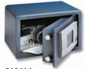
P 1 E KA 1