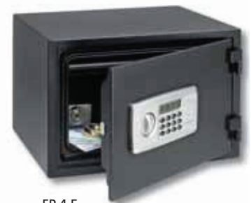
FP 4 E