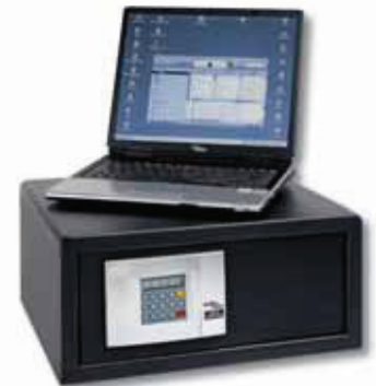
P 3 E Lap